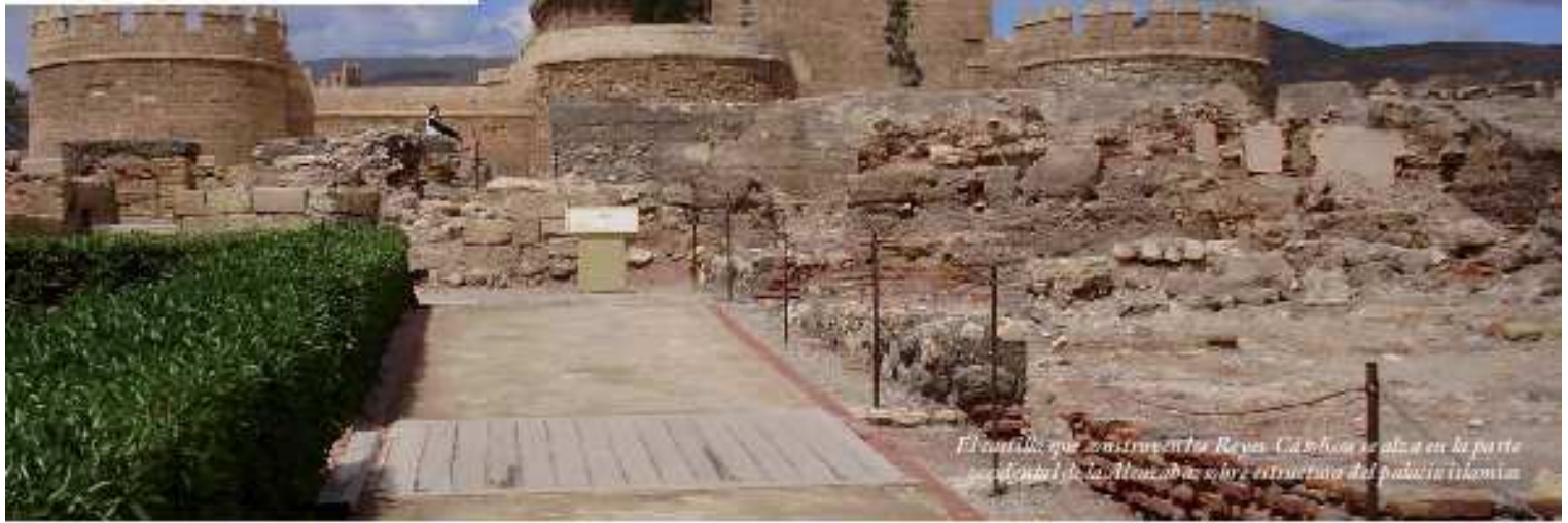
El Castillo que construyeron los Reyes Católicos se alza en la parte superior del Alcazaba sobre estructura del palacio islámico