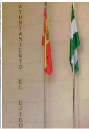
Ayuntamiento de El Ejido