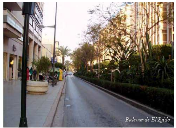
Bulevar de El Ejido