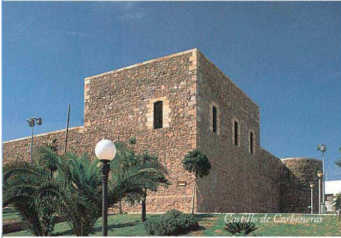
Castillo de Carboneras