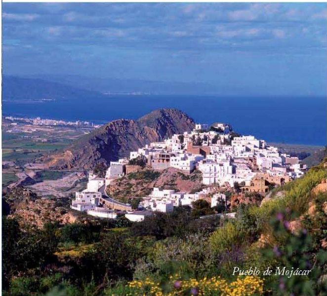
Pueblo de Mojácar

los vestigios del siglo XIX representado en edificios señoriales como la actual sede del Ayuntamiento antes Casa de Los Fuentes. Esta majestuosidad contrasta con la tranquilidad de las playas. Gran parte del municipio de Carboneras, un 82%, se halla dentro de los límites territoriales del Parque Natural Cabo de Gata-Níjar.