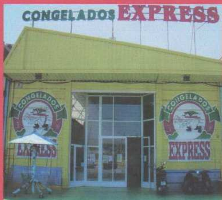
Almería / Polígono la Mezquita Nave 8 950 22 76 40