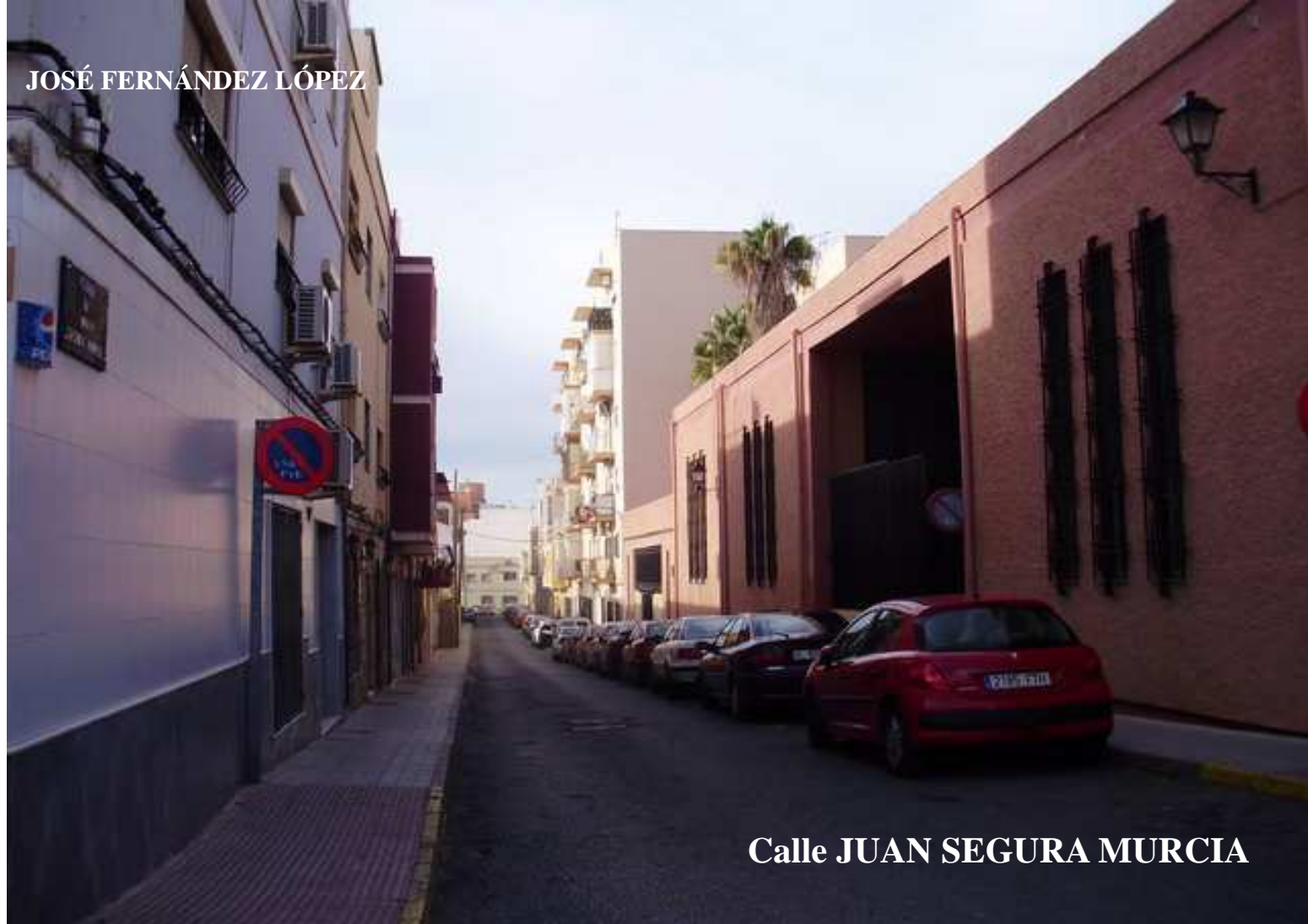
Calle JUAN SEGURA MURCIA