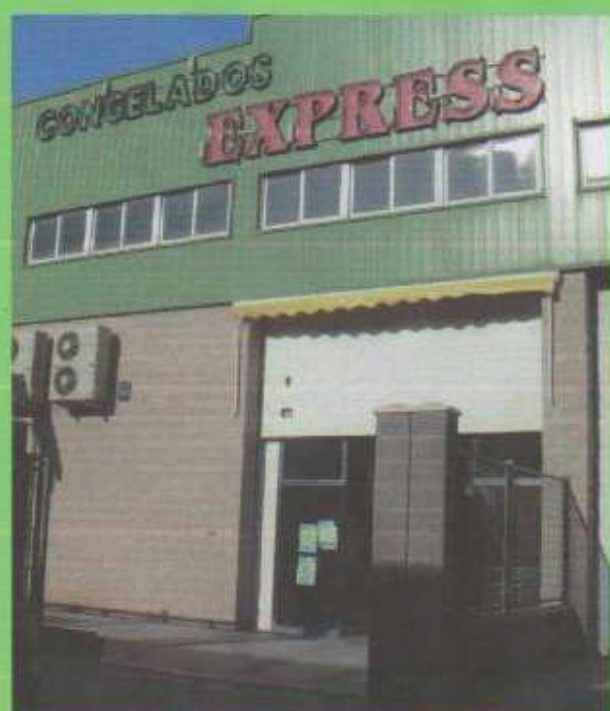
El Ejido / Polígono Murgis, 22 950 57 02 12