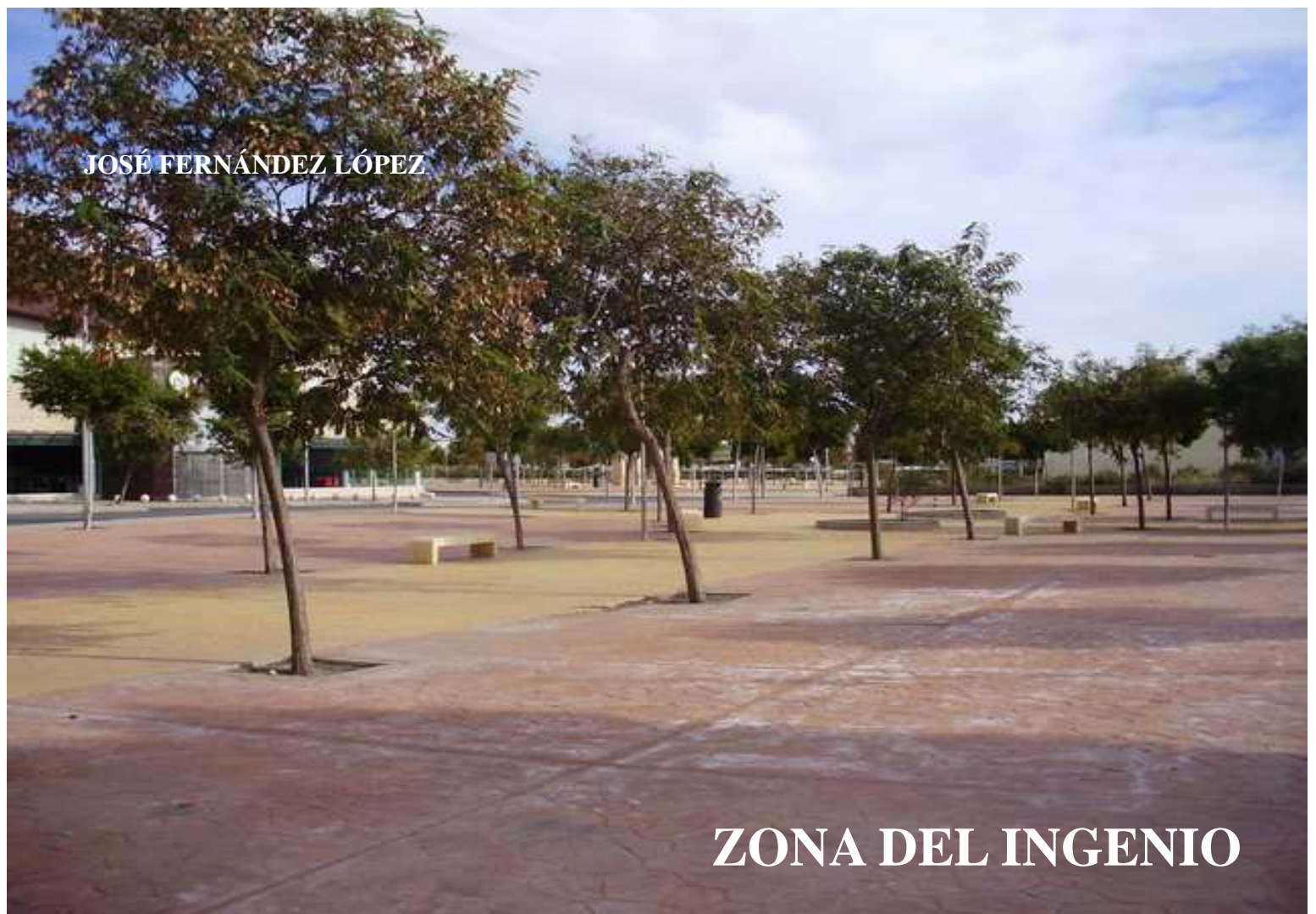
POLIGONO LA MEZQUITA