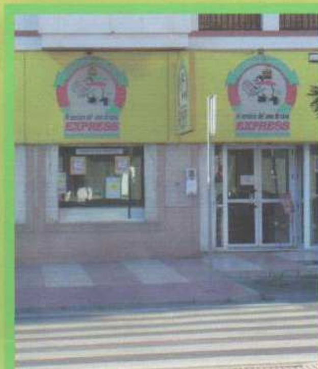
Aguadulce / Avda. Carlos III, 300 950 55 00 90