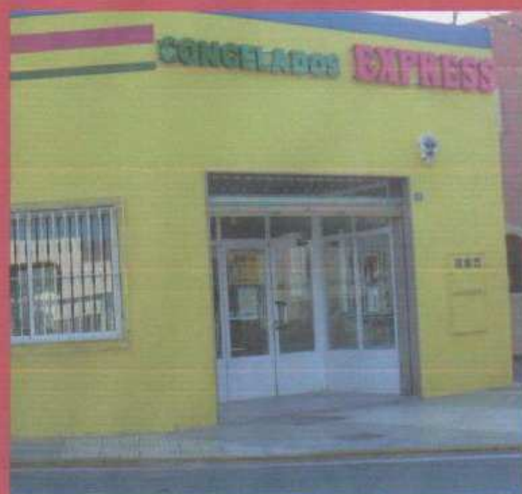
La Mojonera / Avda. Europa, 224 950 62 78 52