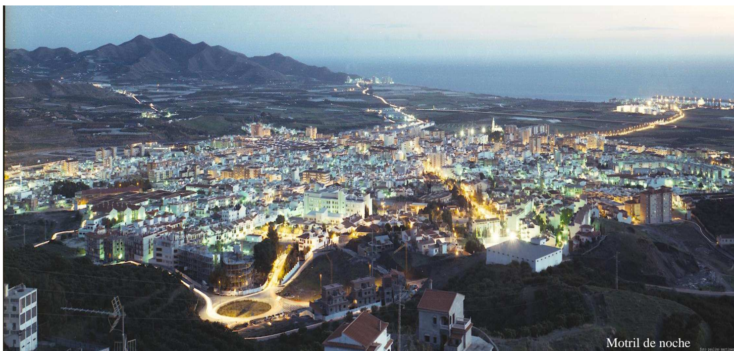
Motril de noche