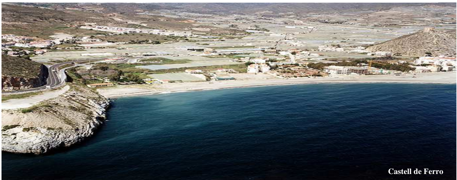
Castell de Ferro

Calahonda cuenta con una población de 1.542 hab. Su playa tiene una longitud de 1.200 metros y unos 40 de ancho. Es una localidad de la entidad local autónoma de Carchuna-Calahonda, en el municipio de Motril (Granada).