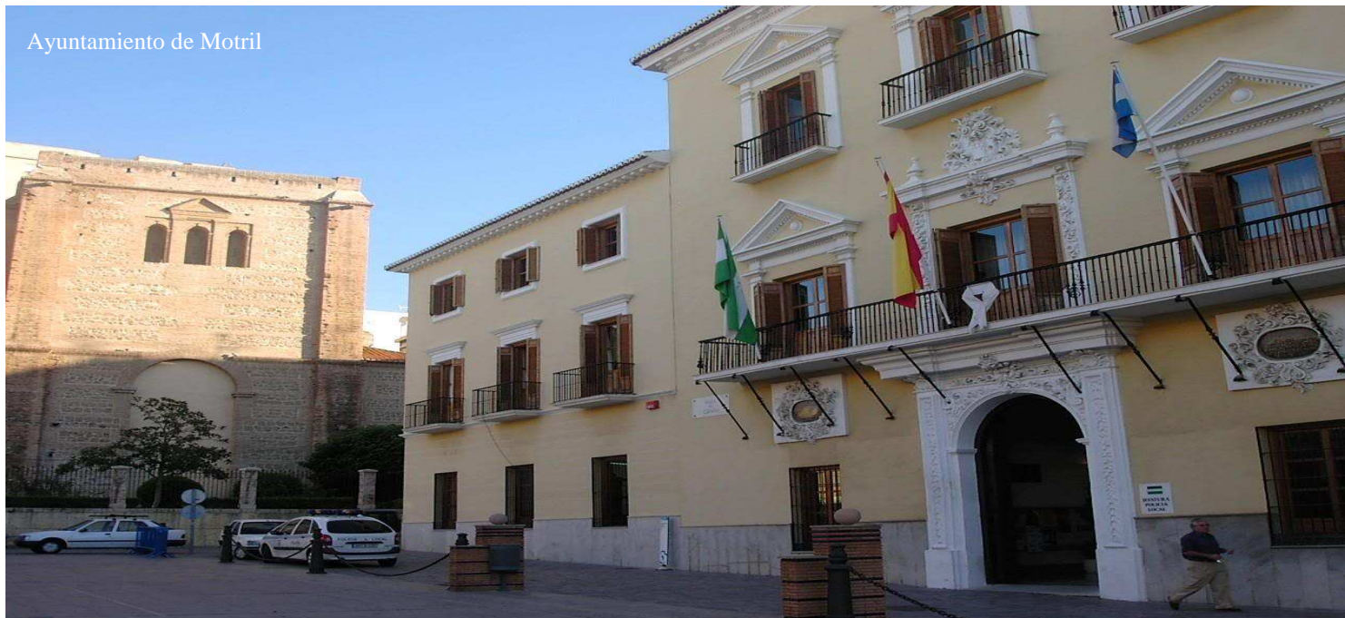
Ayuntamiento de Motril