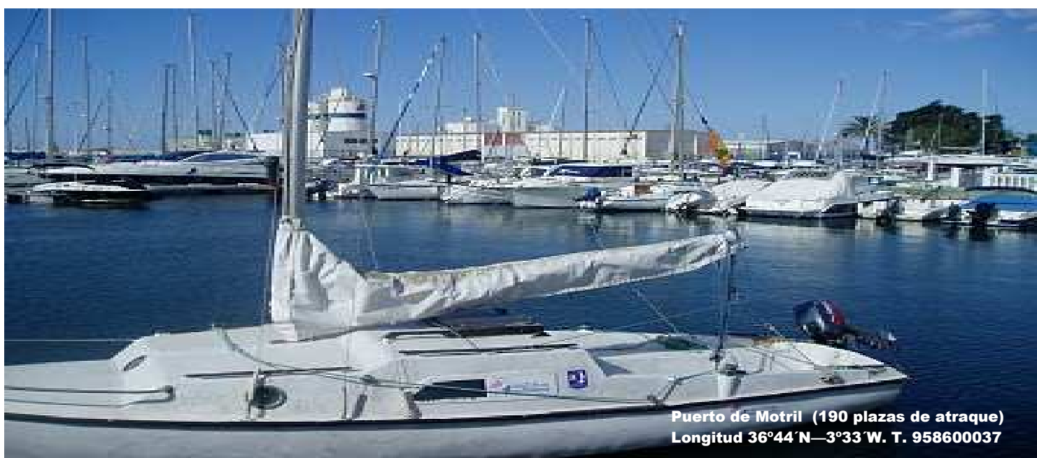
Puerto de Motril (190 plazas de atraque) Longitud 36°44'N—3°33'W. T. 95860037

En el corazón de la Costa Tropical, Motril con 64.884 habitantes, oferta una infinidad de posibilidades. Su vega, sus cultivos tropicales y de caña de azúcar dan lugar a un microclima excepcional con temperaturas anuales en torno a los 20° C, con mas de 320 días de sol al año. Motril es una ciudad dinámica y en crecimiento.