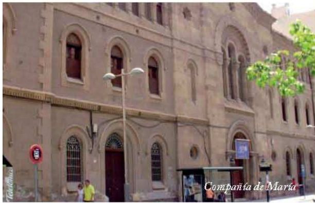
Compañía de María