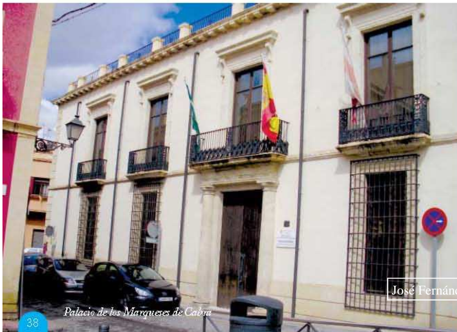
Palacio de los Marqueses de Cabra

La plaza ha recibido varias denominaciones. Los cristianos de Reconquista la llamaron Plaza del Juego de Cañas y del mercado. En 1.812 se llamó Plaza de la Constitución por vez primera. También es conocida popularmente como PLAZA VIEJA.