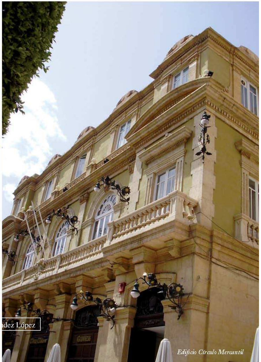
Edificio Círculo Mercantil