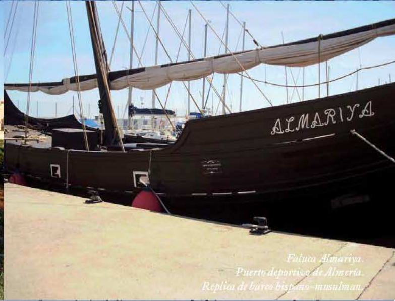
Faluca Almariya. Puerto deportivo de Almería. Replica de barcos hispano-musulman.