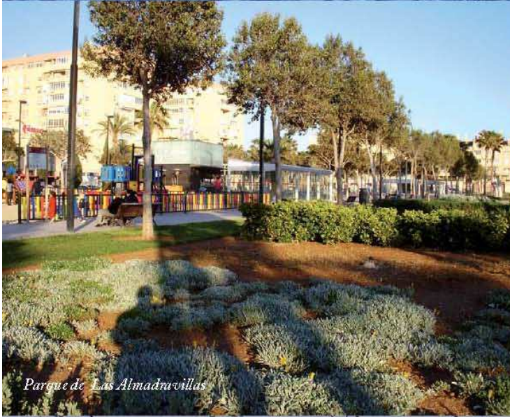
Parque de Las Almadruvillas