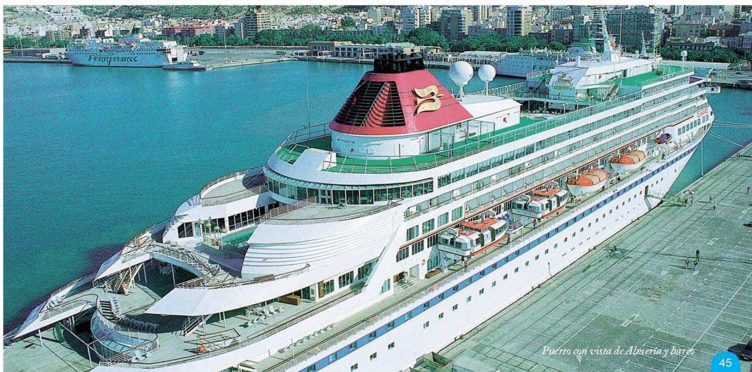
Puerto con vista de Almería y barco